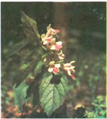
690. Кадило мелісолисте.